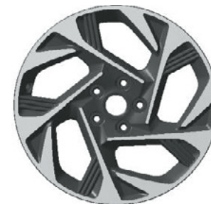
18-дюймдік жеңіл қорытпалы дөңгелек дискілер