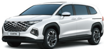
Ақ Crystal White (7F)