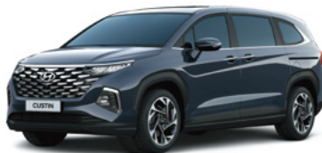
Перламутрлы көк Dark aurora (PK8)