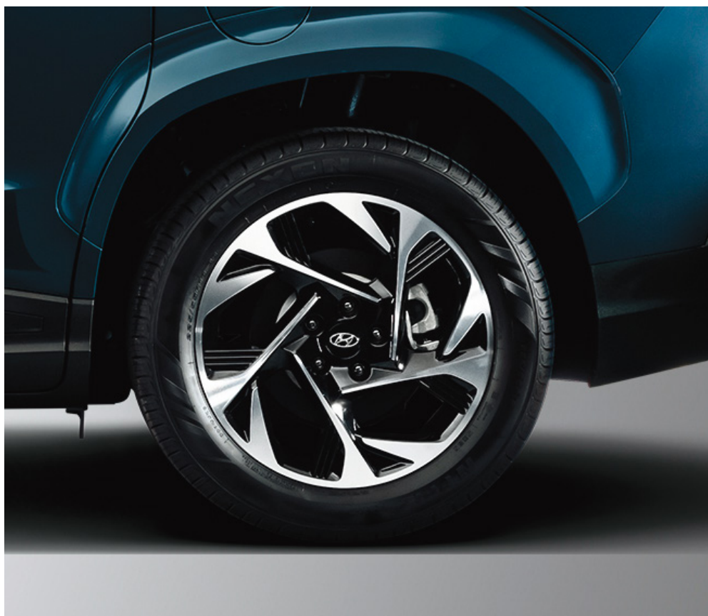
18-дюймдік жеңіл балқығыш дискілер