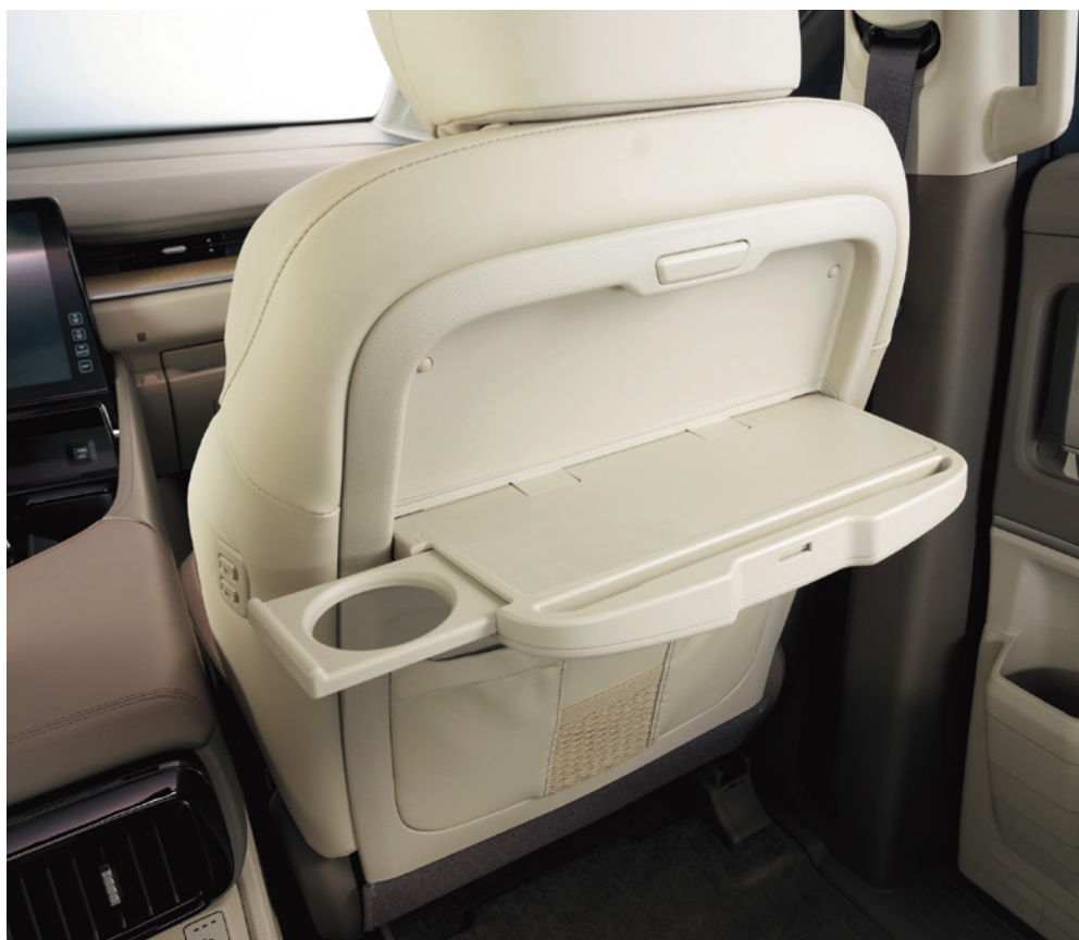
Планшетке арналған тіреуіші бар артқы орындықтағы жиналмалы үстелдер