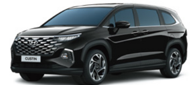
Қара Phantom black (NNB)