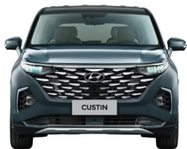
Жалпы ені 1 850 Жолтабан ені 1607/1635