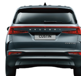
Жолтабан ені 1607/1635