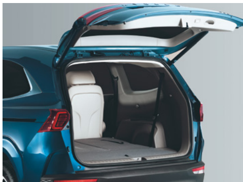
Электржетегі бар жүксалғыш есігі