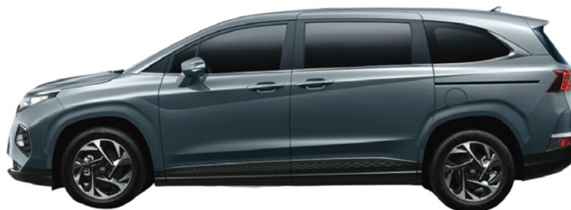
Жалпы ұзындығы 4 965 Дөңгелек базасы 3 055