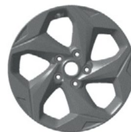
17-дюймдік жеңіл қорытпалы дөңгелек дискілер