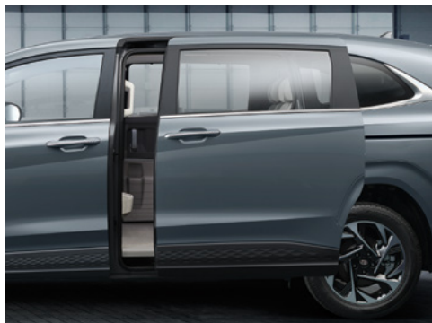
Электржетегі бар жылжымалы есіктер