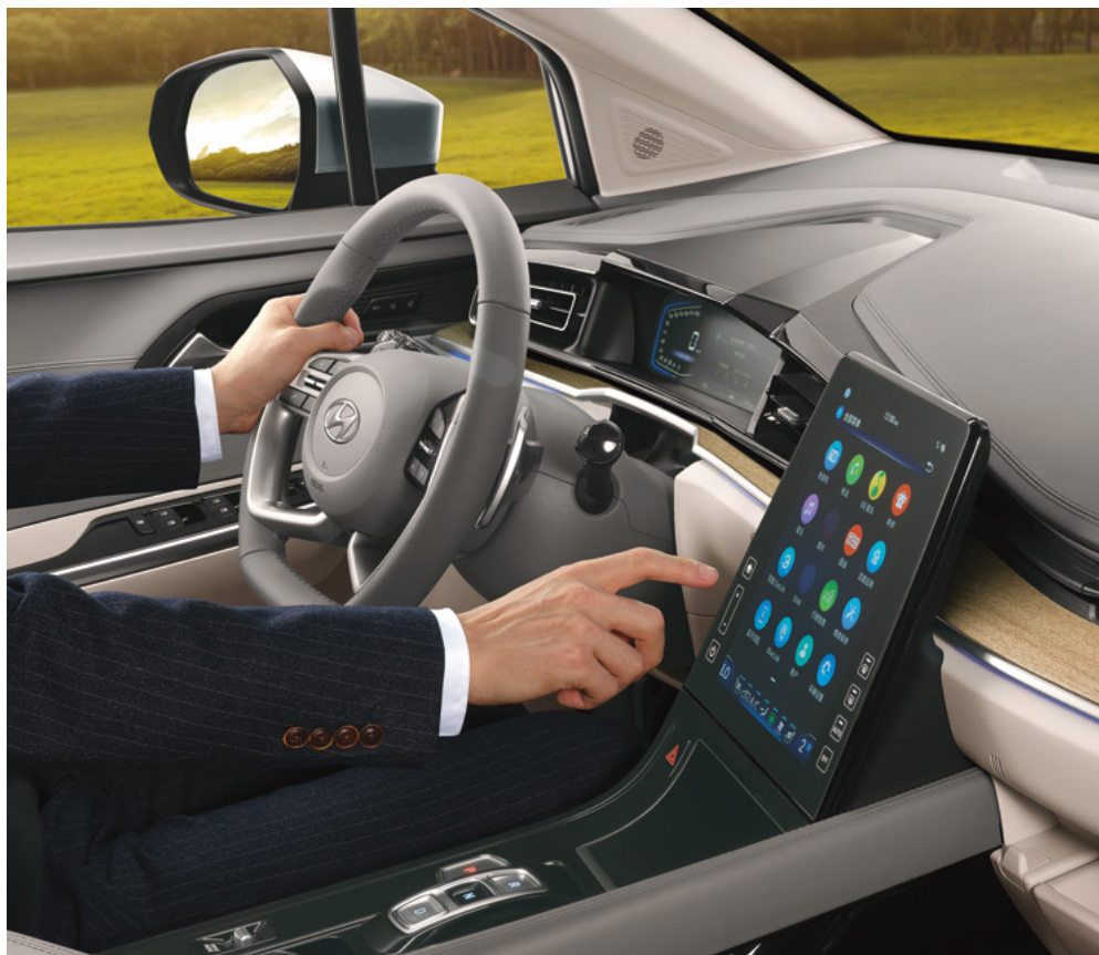
Диагонали 10,4 дюйм орталық экран

Интеллектуалды басқару мүмкіндіктерін пайдаланыңыз, жайлылықтан ләззат алыңыз.