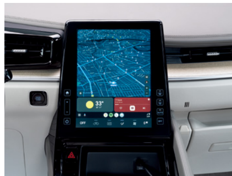
10,4 дюймдік көп функциялы ақпараттық ойын-сауық жүйесі