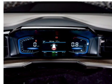
4,2 дюймдік СК-дисплейі бар толығымен цифрлық аспаптар тақтасы