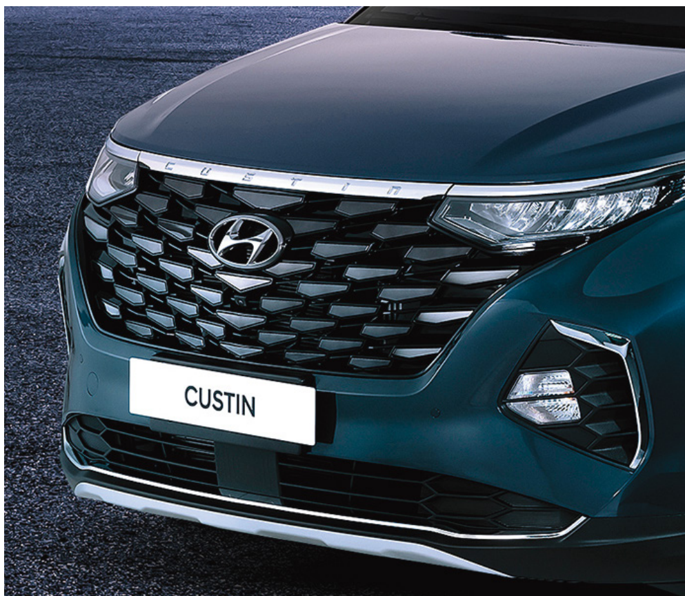
Күндізгі жүріс шамдары (КЖШ) бар ромб түріндегі параметрлік радиатор торы