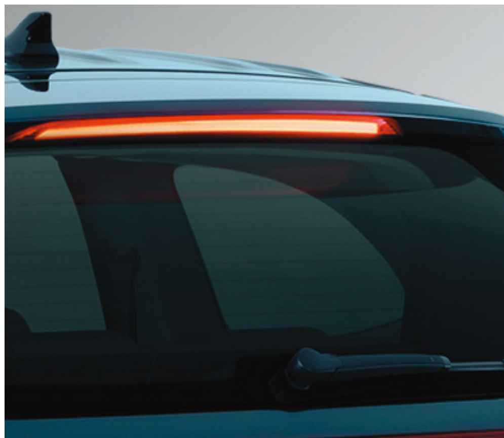
Қосымша тоқтау сигналы бар артқы спойлер