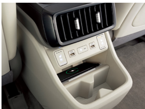
Артқы сымсыз зарядтау құрылғысы