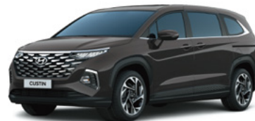
Қоңыр Ebony brown (XM8)