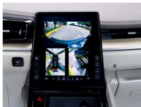
Айнала шолу жүйесі