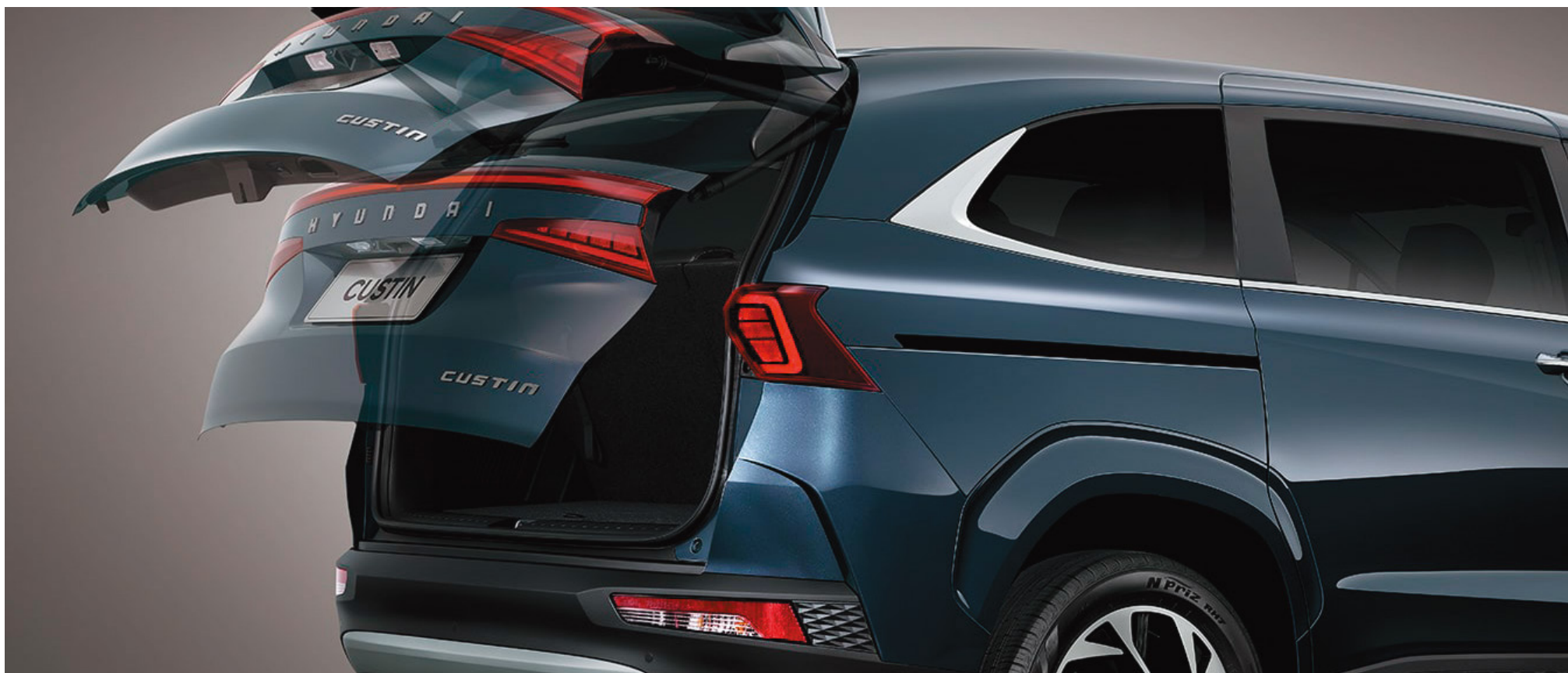
Электржетегі бар жүксалғыш есігі