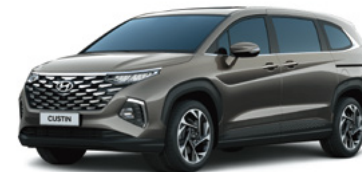
Сұр Military gray (REY)