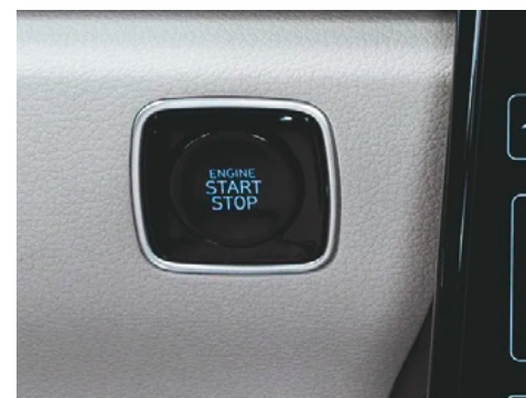
Smart Key Кілтісіз ашу жүйесі және қозғалтқышты оталдыру батырмасы