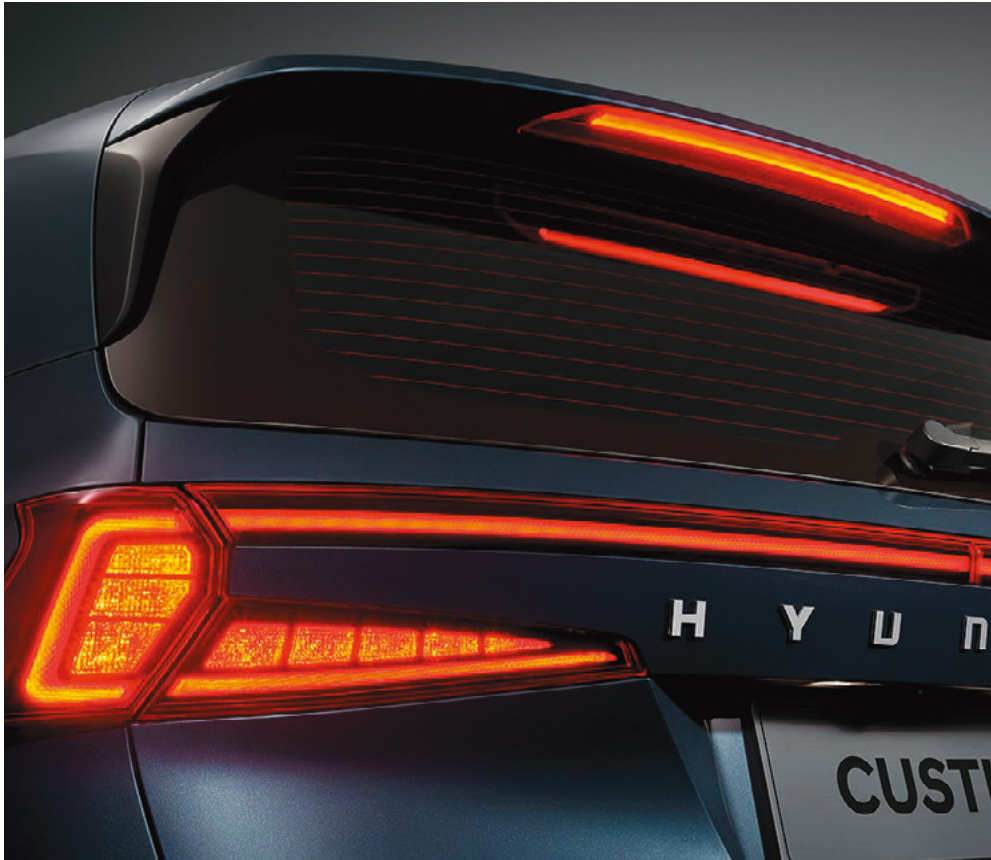
Артқы шамдардың жарықдиодты блогы