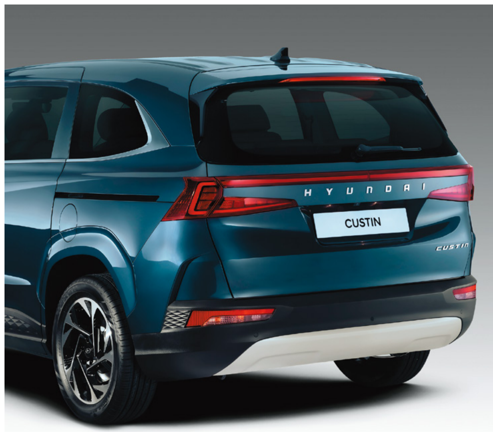
Біріктірілген түрдегі артқы жарықдиодты шамдар