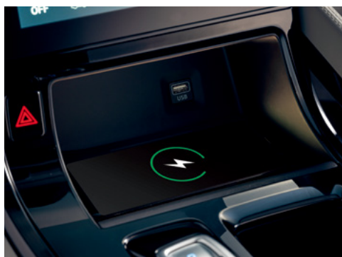
Алдыңғы сымсыз зарядтау құрылғысы