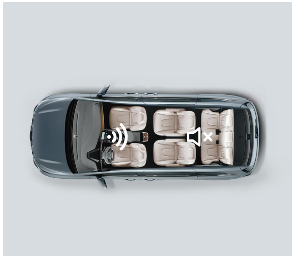
Орындықтардың екінші және үшінші қатарлары үшін дыбысты өшіру

Отбасыңыз сапар кезінде тыныш ұйықтай алуы үшін мультимедиялық жүйенің экраны арқылы екінші және үшінші қатардағы дыбысты өшіруге болады.