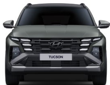
Ширина колеи (для колес диаметром 19 дюймов)* 1 615 Габаритная ширина 1 865