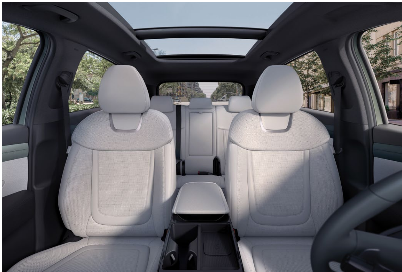
Передние и задние сиденья

Освободите место для большего. Лучшие в классе показатели вместительности багажника и салона подойдут для разных стилей жизни и занятий, обеспечивая непревзойденную универсальность.