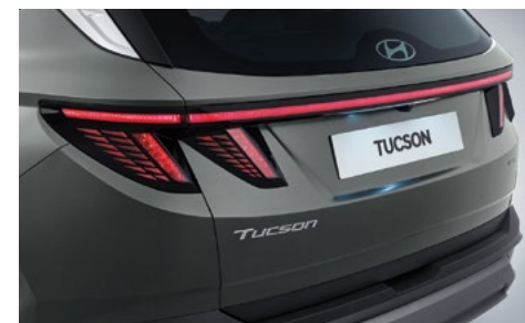
Светодиодные комбинированные задние фонари