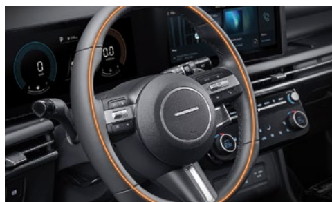
Рулевое колесо с подогревом