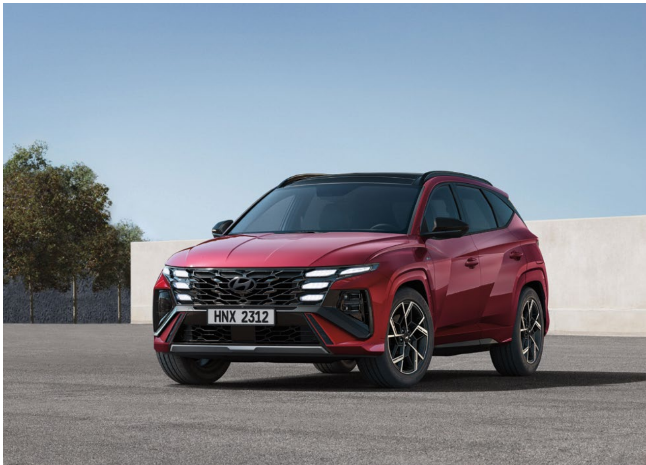
Эксклюзивная решетка радиатора N Line

Новый TUCSON N Line получил эксклюзивный дизайн и ждет встречи с теми, кто предпочитает дополнительные штрихи спортивности.