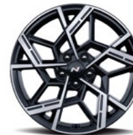
19-дюймовые легкосплавные колесные диски (версия N Line)