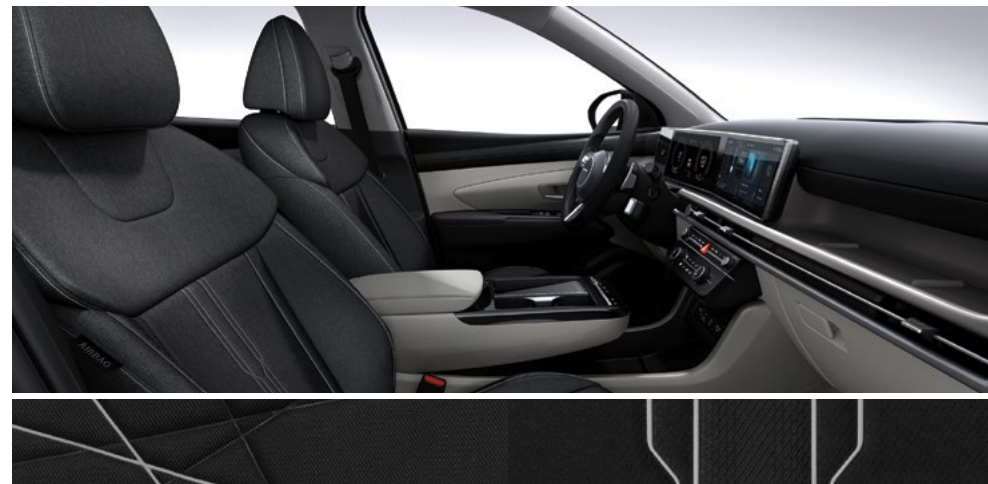
Серо-черный двухцветный (ткань)