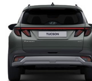
Ширина колеи (для колес диаметром 19 дюймов)* 1 622