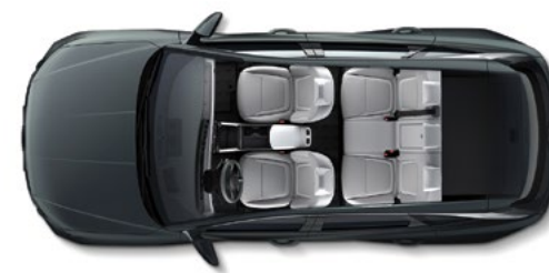
Стандартная компоновка салона