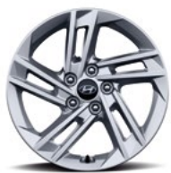
17-дюймовые легкосплавные колесные диски (NX4)