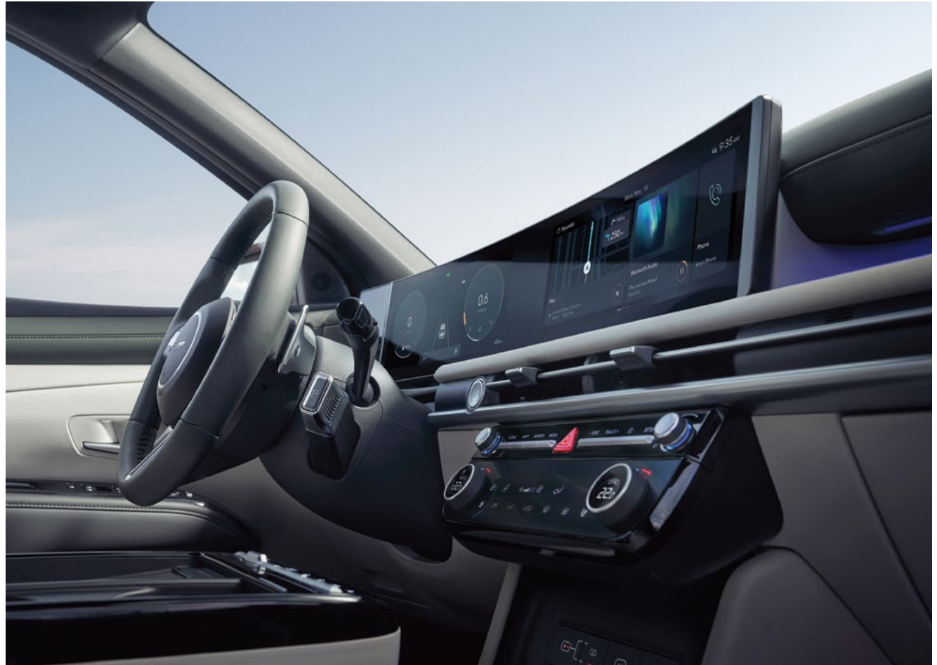
Панорамный изогнутый дисплей: приборная панель диагональю 12,3 дюйма и центральный дисплей диагональю 12,3 дюйма