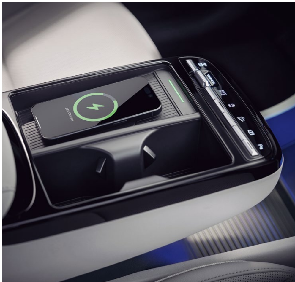
Беспроводное зарядное устройство

Новый подход к компоновке салона и набор интуитивных технологий гарантируют вам легкую и удобную эксплуатацию автомобиля.