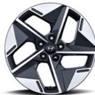
18-дюймовые легкосплавные колесные диски