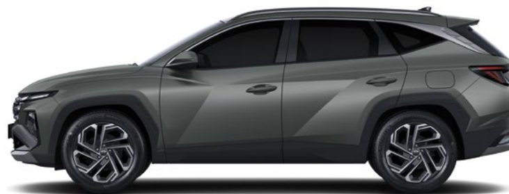
Колесная база 2 755 Габаритная длина 4 640

Габаритная высота (с рейлингами на крыше)