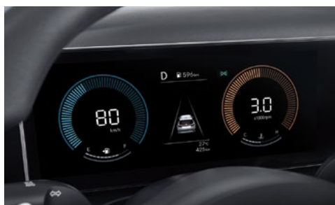
4,2-дюймовый ЖК-дисплей панели приборов