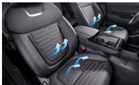
Передние сиденья с подогревом и вентиляцией