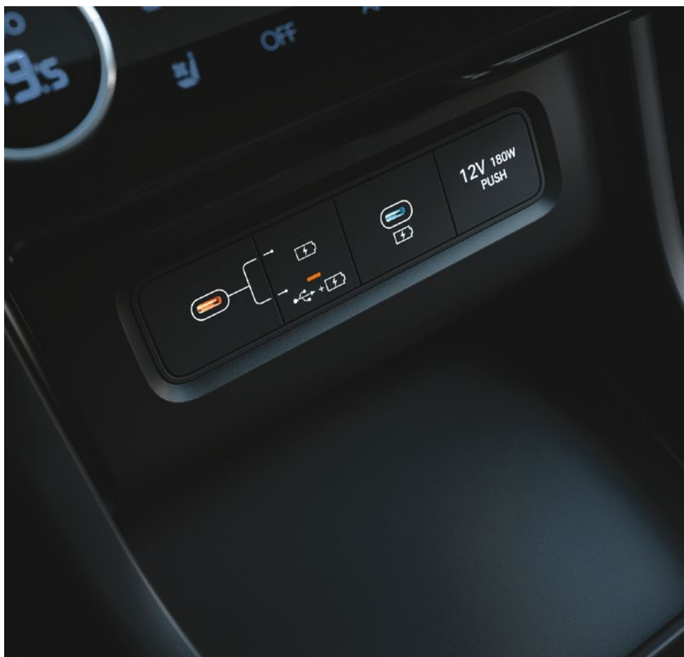
Порты USB-C для зарядки и подключения устройств