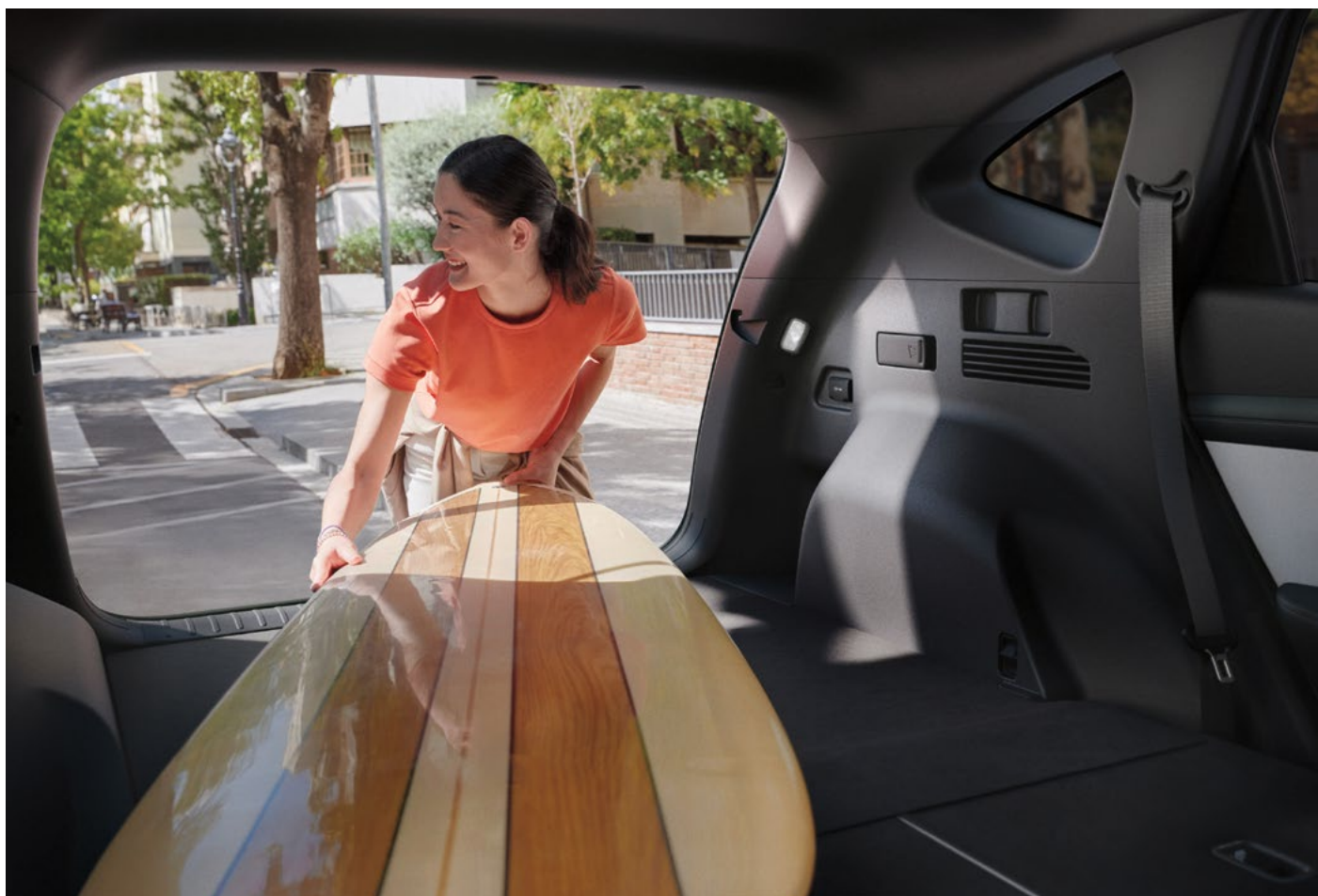
Складываемые сиденья / Функция дистанционного складывания