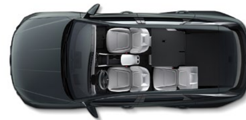
Складывание спинок в соотношении 6:4