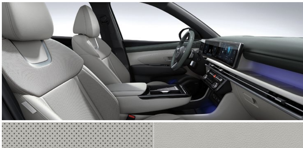
Зеленый трехцветный (кожа)