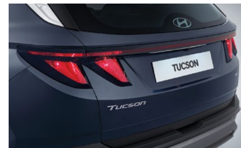
Комбинированные задние фонари (с галогеновыми лампами)