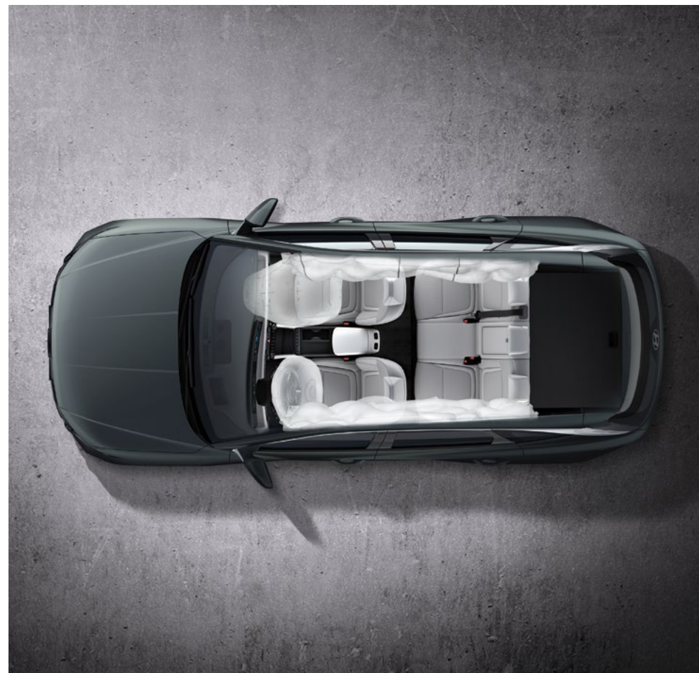
Шесть подушек безопасности