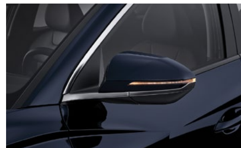
Светодиодные указатели поворота в корпусе зеркал заднего вида