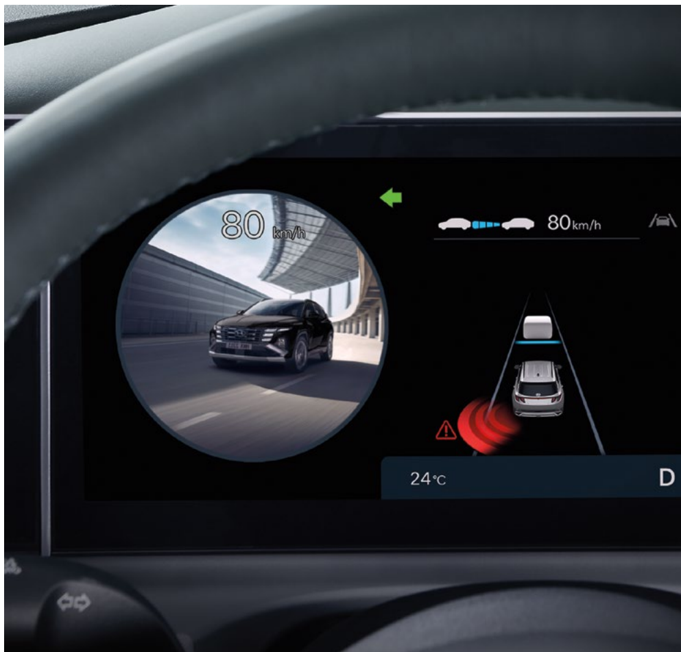
Система мониторинга слепых зон (BVM)

Новый TUCSON оснащается надежными системами, которые защищают вас от непредсказуемых событий и проверяют, чтобы вы никого не забыли в салоне.