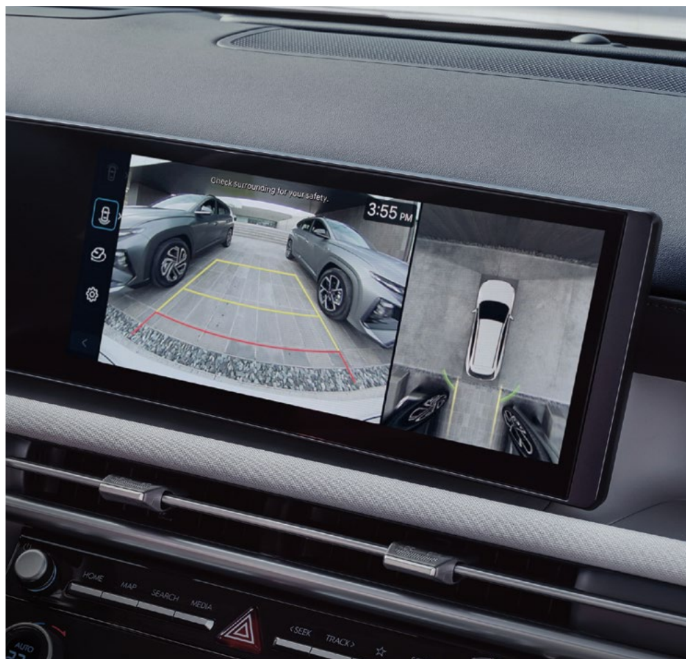
Система кругового обзора (SVM)