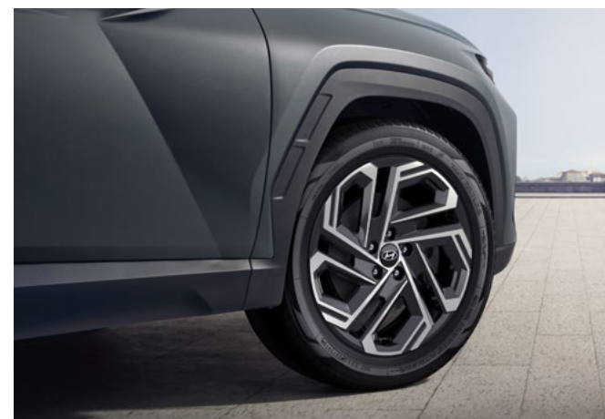
Рейлинги на крыше / Панорамная крыша с люком 19-дюймовые легкосплавные колесные диски