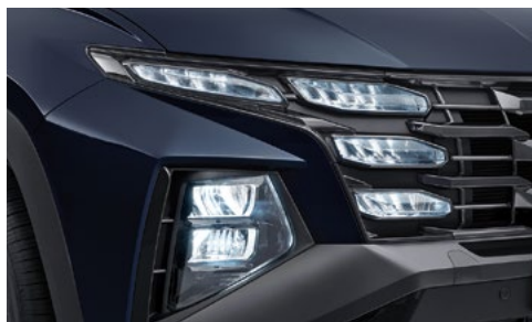
Полностью светодиодные фары головного света (MFR)