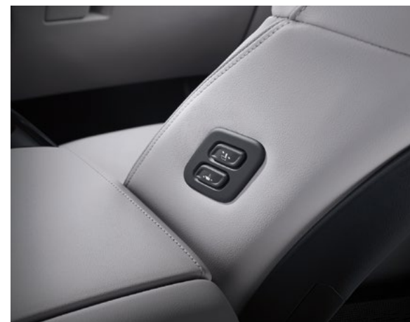
Интегрированная система запоминания положения сидений Упрощенная система доступа (для пассажира)