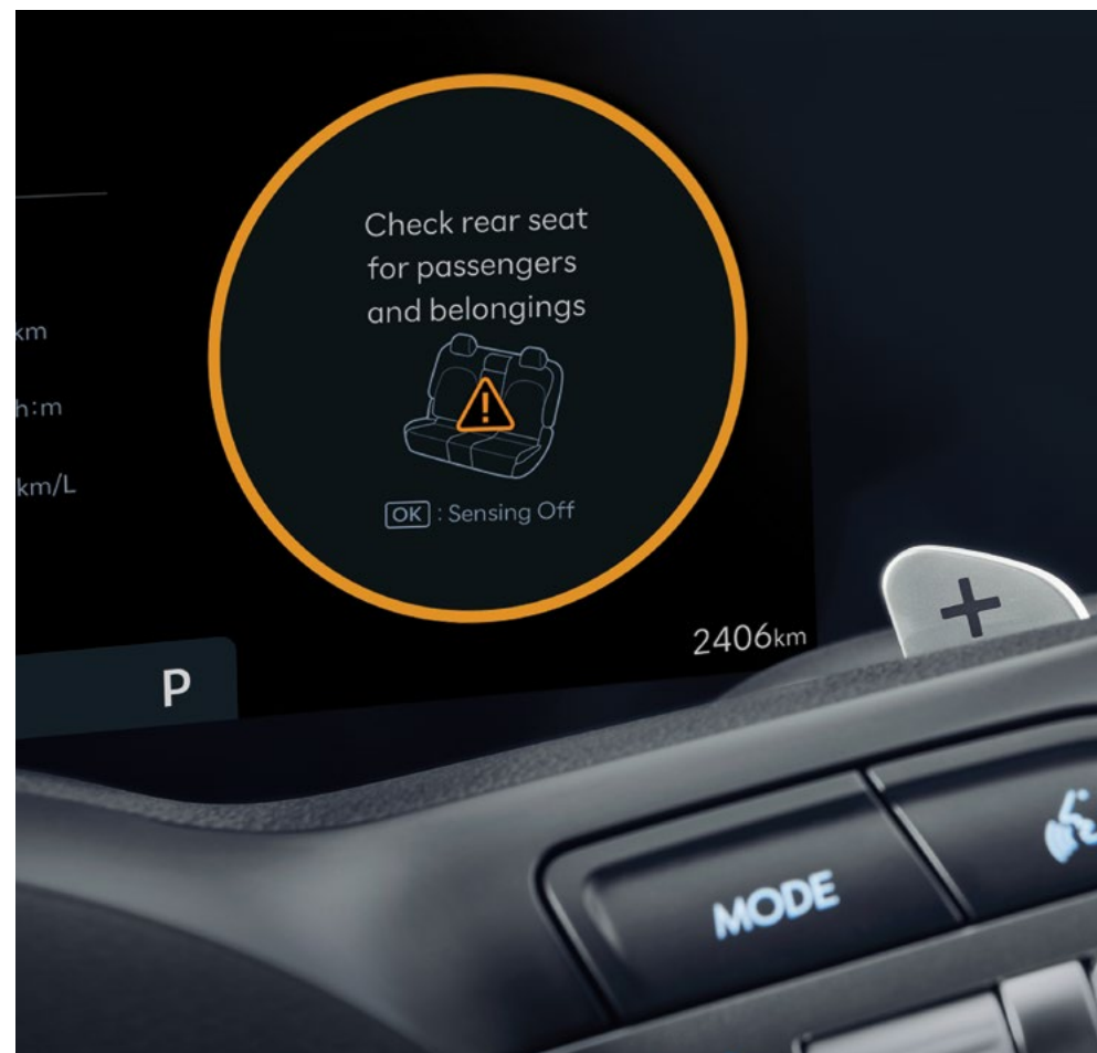
Функция предупреждения о присутствии пассажиров на задних сиденьях (ROA)