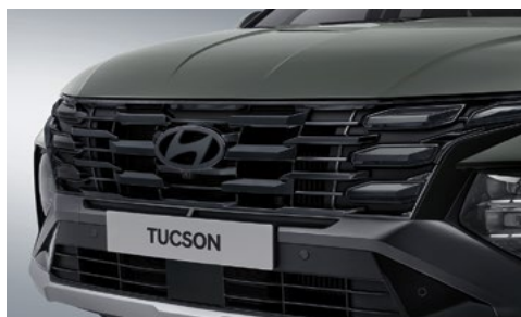
Решетка радиатора с черным хромированием (дневные ходовые огни Hidden Lighting)