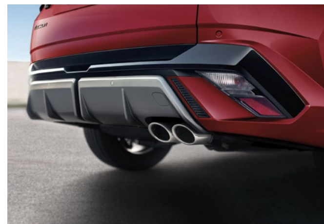
Эксклюзивные 19-дюймовые легкосплавные колесные диски N Line / Накладки в цвет кузова Эксклюзивные двойные патрубки выхлопной системы N Line