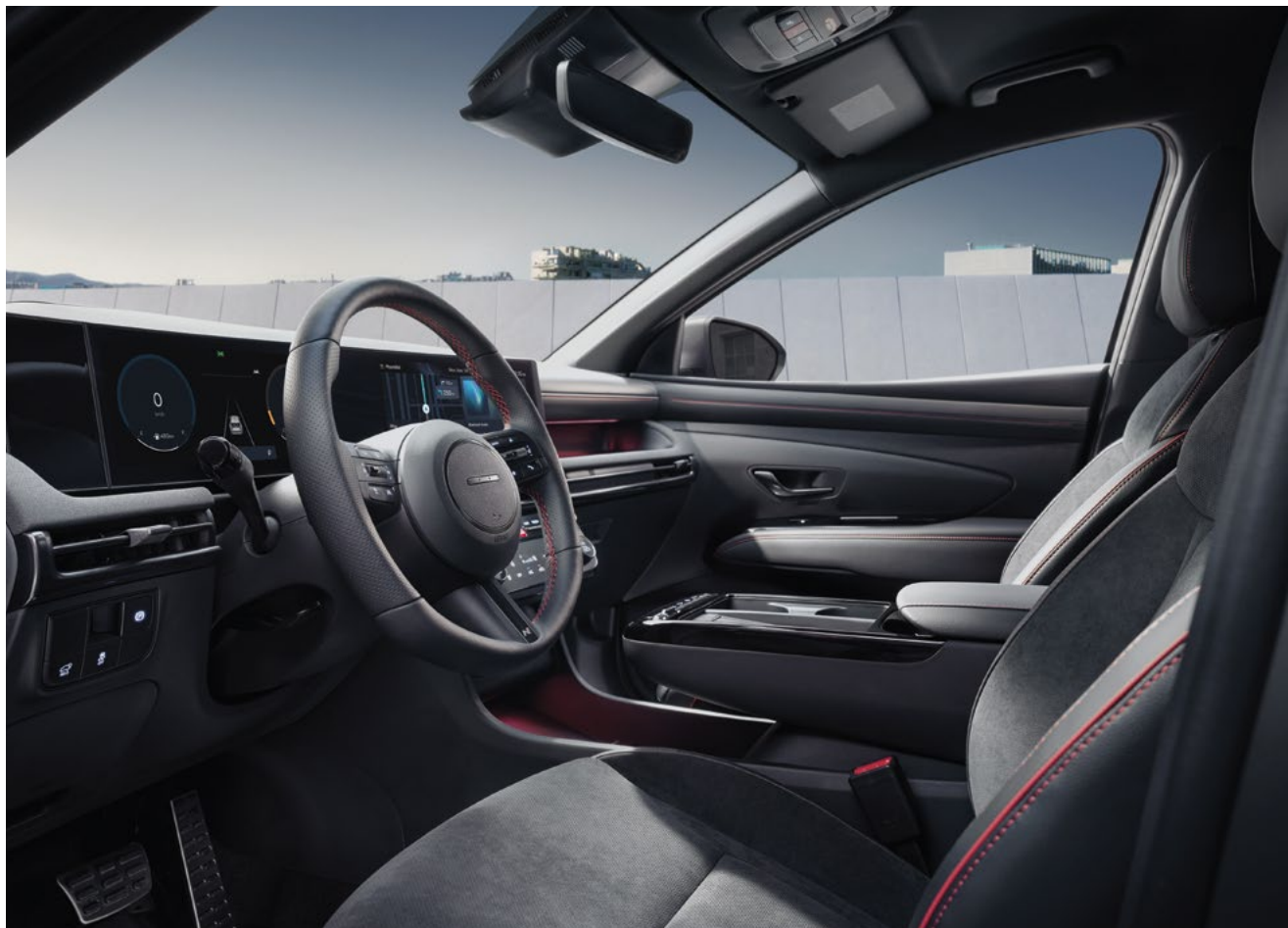
Эксклюзивный интерьер N Line (эмблема N Line на рулевом колесе / Красная прострочка)