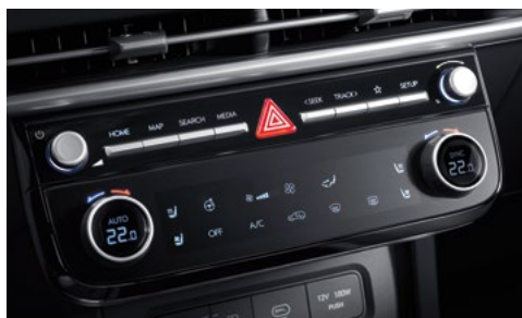
Полностью автоматическая система кондиционирования