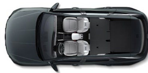
Полностью сложенные задние сиденья