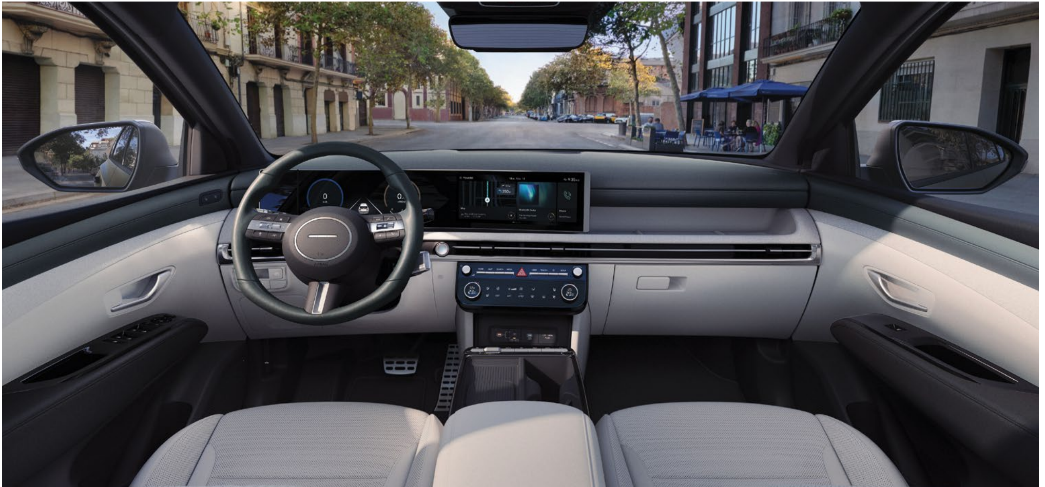
Окружающая архитектура интерьера

Широкий горизонтальный дизайн интерьера окружает пассажиров единой архитектурой, в которой соединяются технологии и стиль.