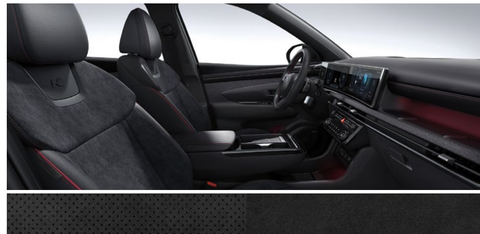
Черный (замша + кожа) с красной прострочкой