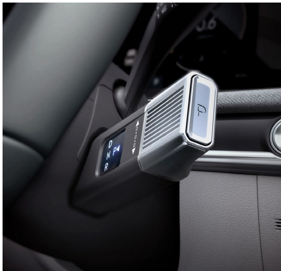
Рычаг селектора передач на рулевой колонке (SBW)