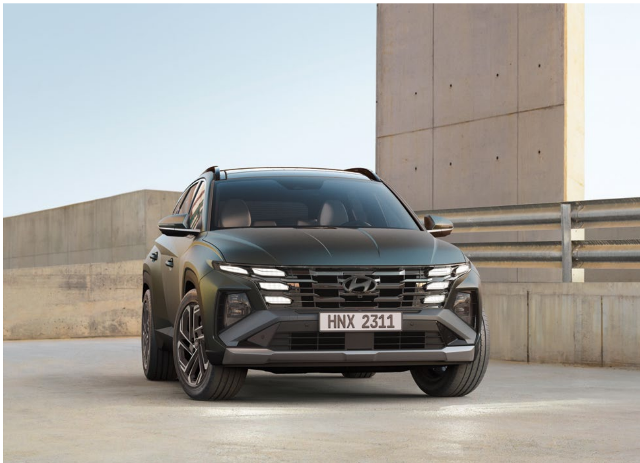
Параметрический дизайн фирменных огней / Решетка радиатора / Передний бампер

Скажите «нет» обыденности благодаря выразительным элементам фронтальной оптики и боковым панелям кузова, напоминающим огранку драгоценного камня. Смелое обновление дизайна позволит вам ярко выделиться на общем фоне.