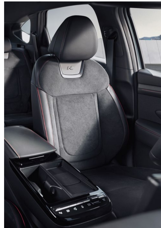
Эксклюзивная обивка сидений замшей N Line