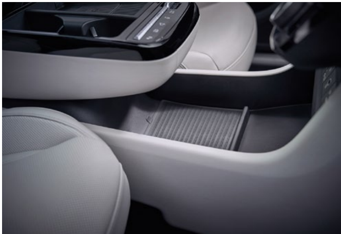
Атмосферная подсветка / Отсек в центральной консоли Парящая консоль