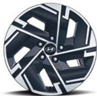
17-дюймовые легкосплавные колесные диски (NXe)