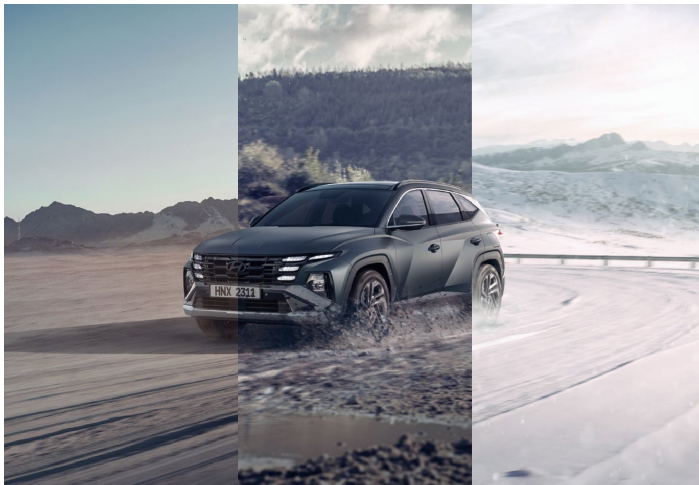
Система управления полным приводом HTRAC / Режимы вождения Terrain Mode (песок, грязь, снег) Новый TUCSON с системой полного привода обеспечивает оптимальные ходовые качества благодаря активному распределению тяги между колесами передней и задней оси с учетом разных дорожных ситуаций.