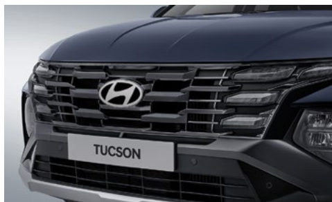
Черная решетка радиатора (дневные ходовые огни Clear Type)