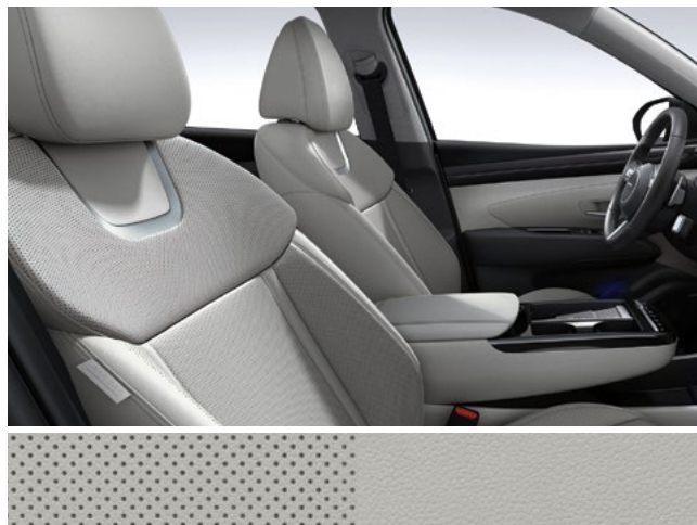
Серо-черный двухцветный (кожа)