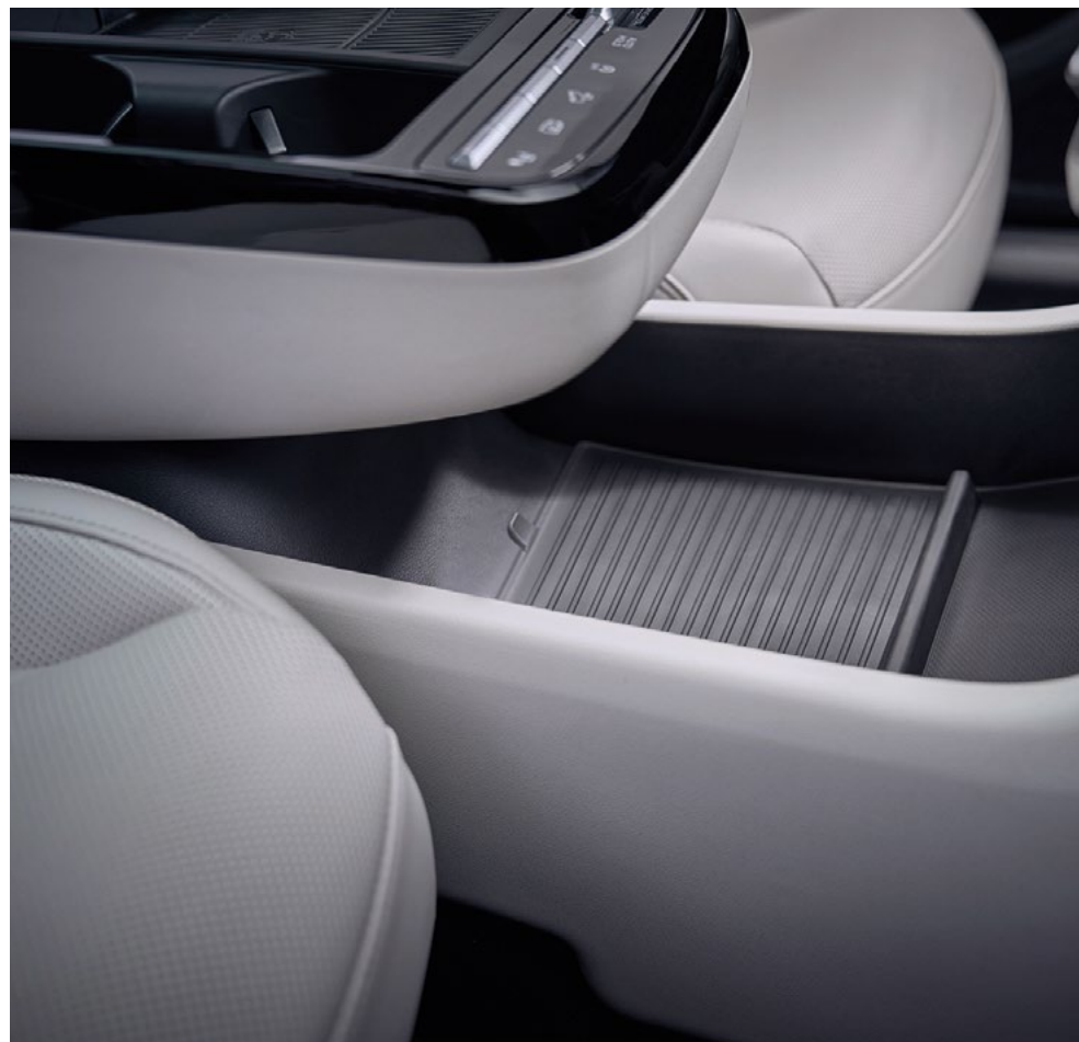
Удобное место для хранения