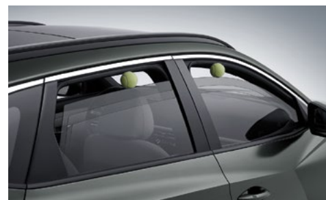
Электрические стеклоподъемники с функцией защиты от защемления