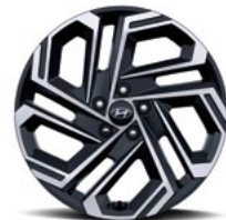
19-дюймовые легкосплавные колесные диски