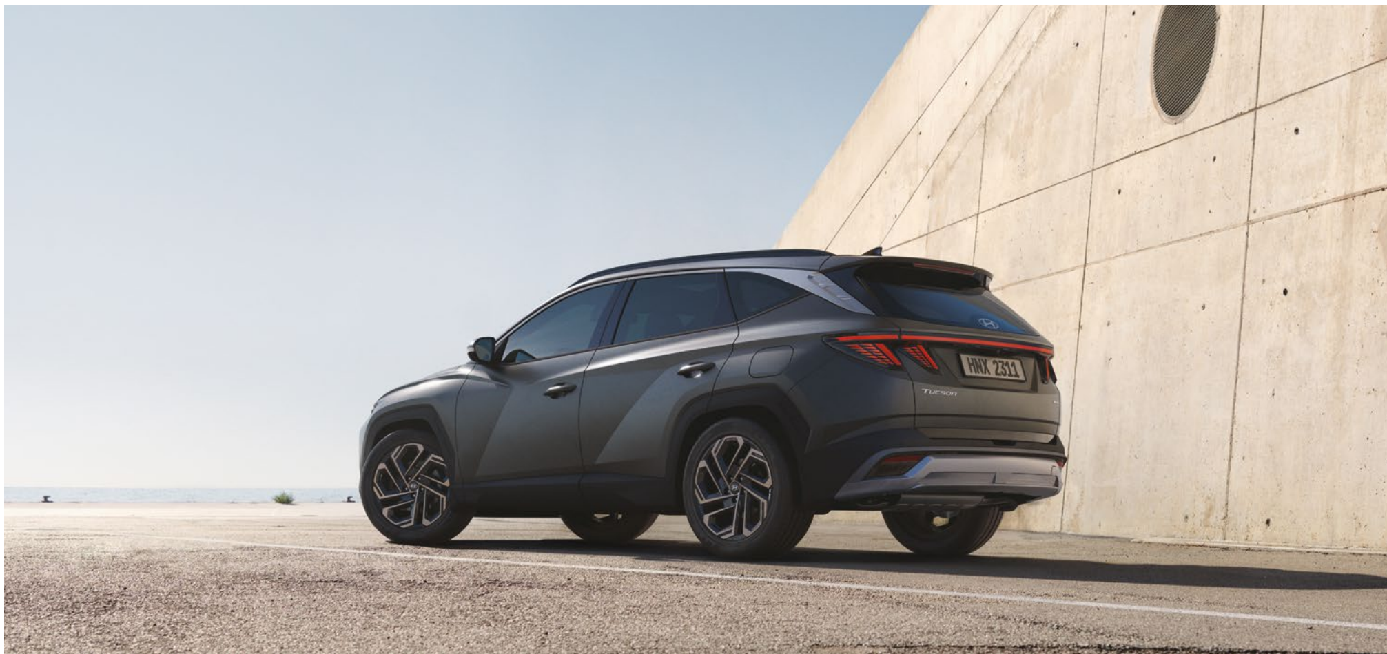
Светодиодные задние комбинированные фонари / Задний бампер / Параметрический дизайн панелей кузова