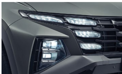
Полностью светодиодные фары головного света (широкий угол освещения и интеллектуальная система управления светом IFS)